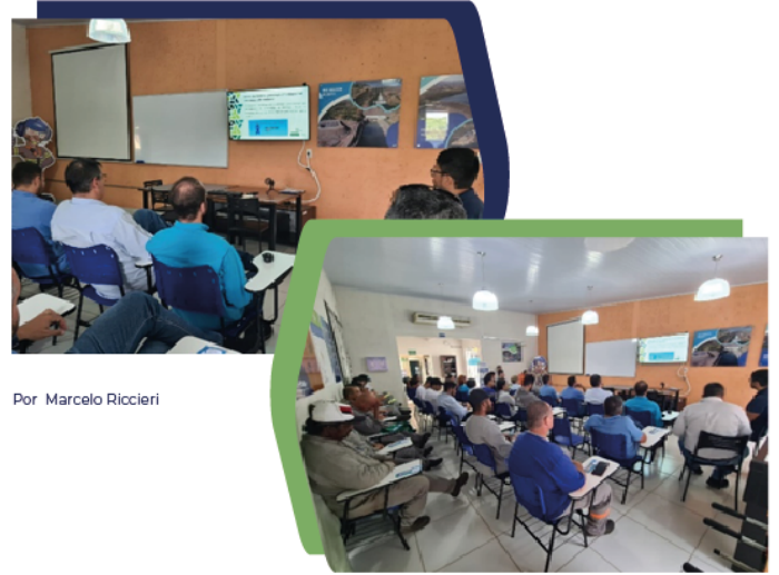
Por: Marcelo Riccieri

Novembro Azul e a prevenção do câncer de próstata: A campanha "Novembro Azul" foi lançada no Brasil pela primeira vez em 2008. O Novembro Azul tem como objetivo sensibilizar e conscientizar a população masculina em relação aos cuidados com a saúde e a importância da realização dos exames de prevenção contra o câncer de próstata, o mais frequente entre os homens depois do câncer de pele. O Dia Mundial de Combate ao Câncer de Próstata é no dia 17 de novembro. Foi realizado pelo CCBE uma palestra em seu DDS com colaboradores e terceiros. Cuide-se. Previna-se!