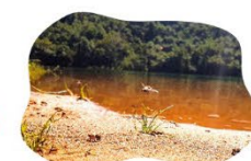
Olavo Silveira - CCBE