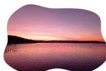
Célio Edmundo - RIP